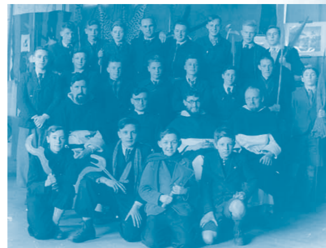
Campus St.-Hubertus: 'Over collegepinnen en heren professoren'