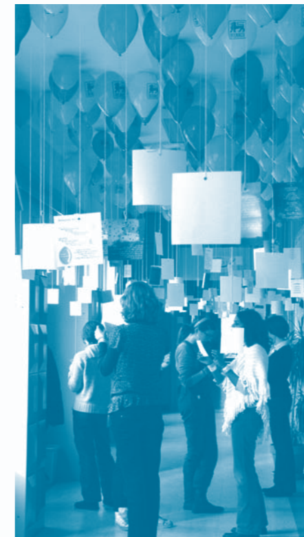
Gedichtendag Sint-Jozef Lommel