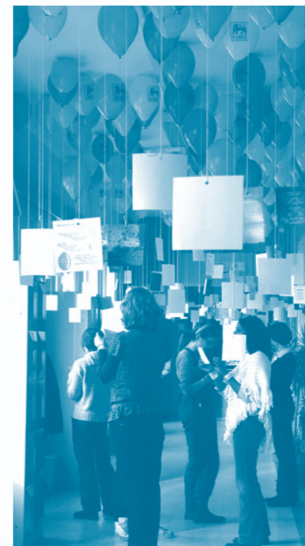
Gedichtendag Sint-Jozef Lommel