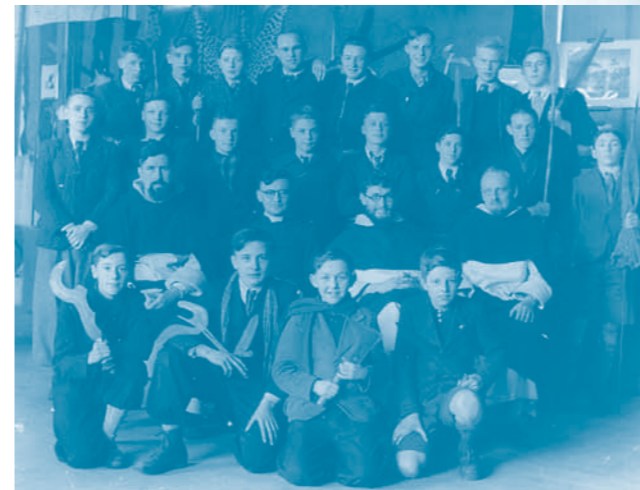
Campus St.-Hubertus: 'Over collegepinnen en heren professoren'