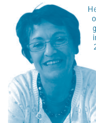
Vraag naar huiswerkbegeleiding immers niet meer aan.

Het project 'huiswerkbegeleiding' werd op het getouw gezet n.a.v. het overleg georganiseerd door de provincie Limburg in het kader van 'Kansensbank-Limburg' in 2008. Tijdens dit overleg werd onder meer geïnformeerd naar lopende projecten die jongeren ondersteuning bieden tijdens hun schoolloopbaan. Daarnaast peilde men naar de nood aan nieuwe initiatieven. Het basisonderwijs heeft toen aangegeven dat er behoefte was aan huiswerkbegeleiding . De vrijwilligersorganisatie Auxilia kon de